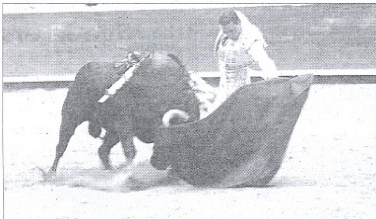
El toro, humillando a más no poder; el torero, recreando la pupila con este bello natural.