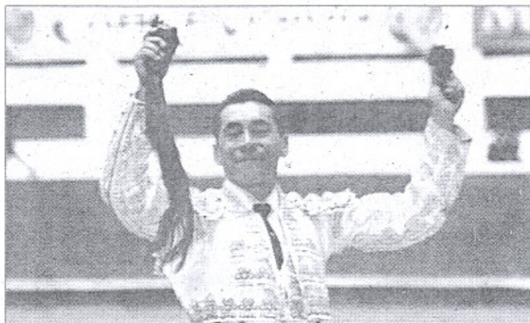
"ZOTOLUCO" muestra las orejas y rabo de Nuestro Rey, toro de Begoña, lidiado en Monterrey.